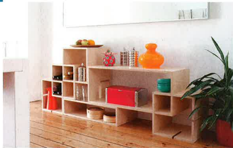
Als wandmeubel in de keuken.