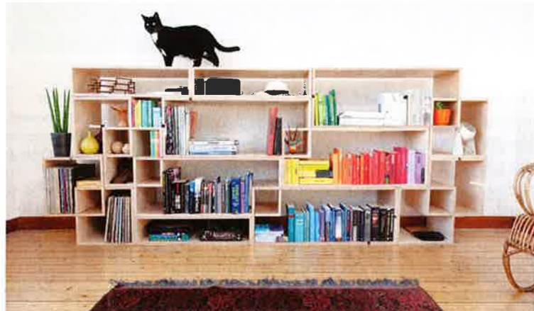
Als reuzenboekenrek in de woonkamer.