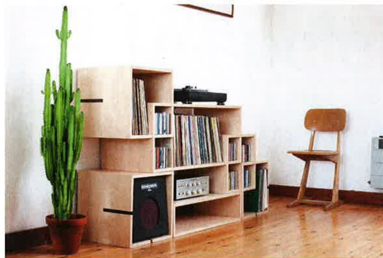
Mooie opbergplek voor muziekinstallatie en lp's.