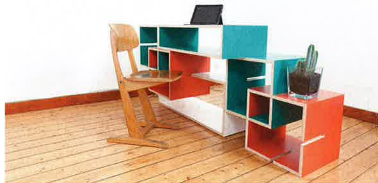
Als bureaumeubel, met gekleurde vlakken.