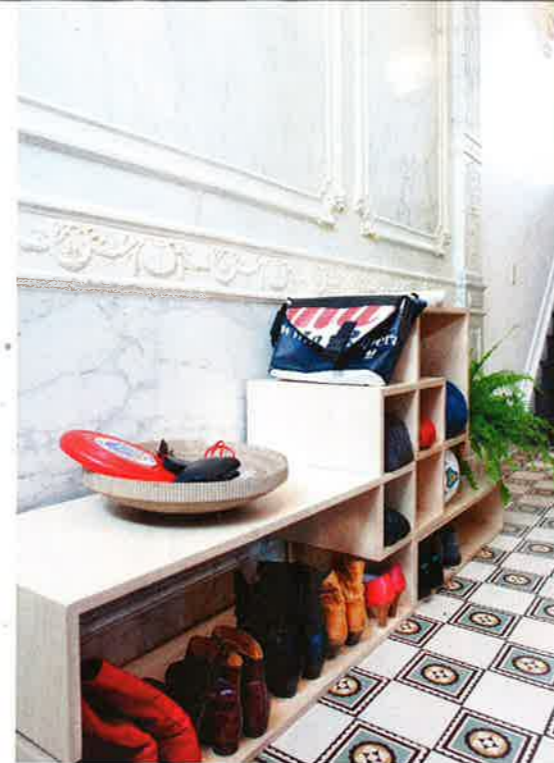
Ideale opbergformule voor schoenen.

"MoModul is het meubel dat zich aanpast aan de veranderlijke levensvormen van de stadsmens"